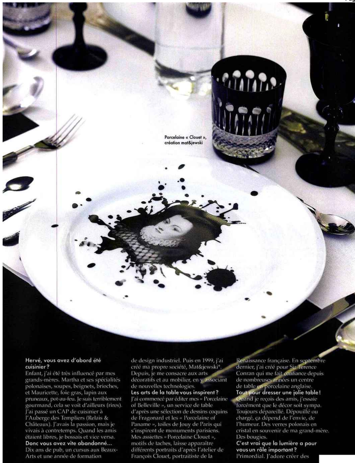
Porcelaine « Clouet », création mat&jewski

Hervé, vous avez d'abord été cuisinier ?