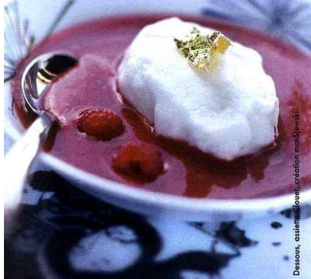
Dessous, assiette Clouet, création matejewski.

A table + Préparez votre coulis vous-même avec 300 g de framboises, 20 g de sucre et 10 cl d'eau, le tout mixé dans un blender et filtré dans un chinois pour ôter les graines.