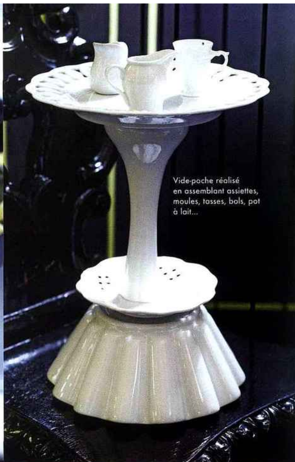
Vide-poches réalisé en assemblant assiettes, moules, tasses, bols, pot à lait...

A table + Vous pouvez varier les légumes, ajouter une tombée de jeunes épinards frais poêlés dans une noisette de beurre, quelques champignons émincés, selon l'inspiration du marché.