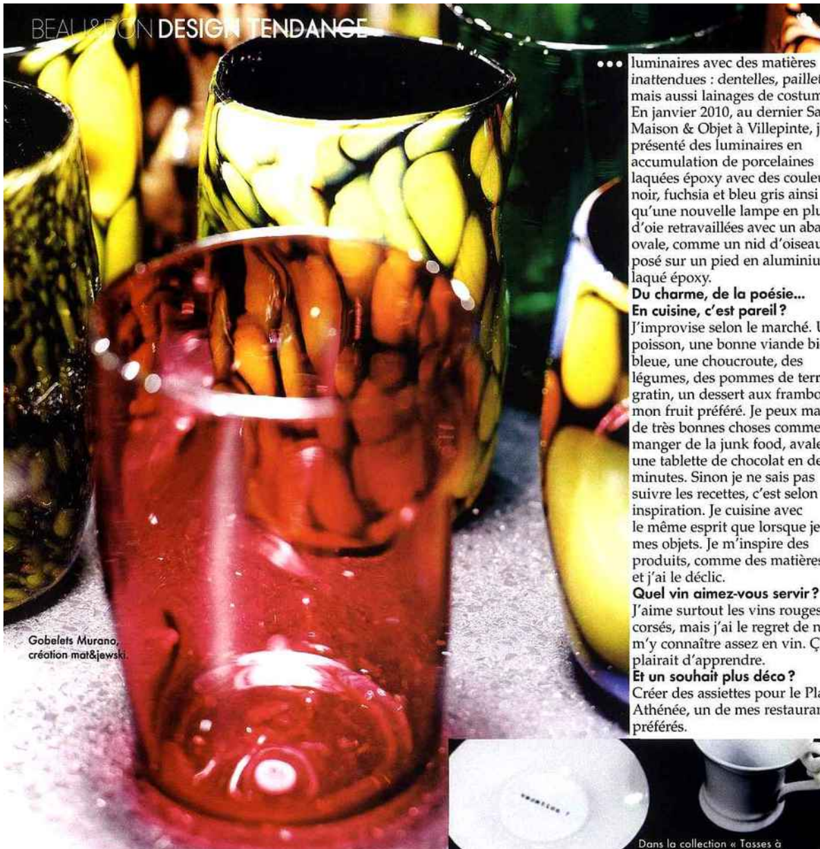
Gobelets Murano, création mat&jewski.

... luminaires avec des matières inattendues : dentelles, paillettes, mais aussi lainages de costume. En janvier 2010, au dernier Salon Maison & Objet à Villepinte, j'ai présenté des luminaires en accumulation de porcelaines laquées époxy avec des couleurs noir, fuchsia et bleu gris ainsi qu'une nouvelle lampe en plumes d'oie retravaillées avec un abat-jour ovale, comme un nid d'oiseau posé sur un pied en aluminium laqué époxy.